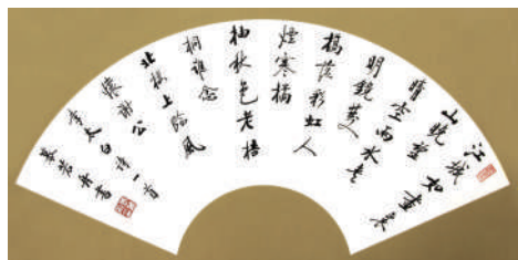
李太白《秋登宣城谢眺北楼》